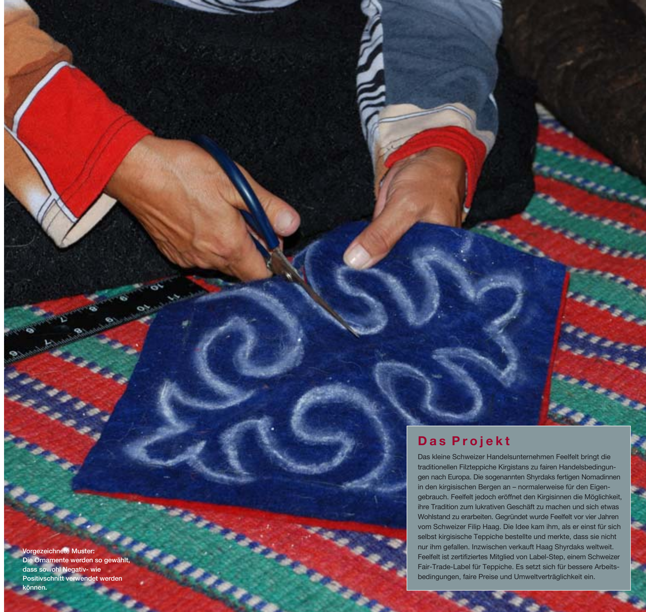
Vorgezeichnete Muster: Die Ornamente werden so gewählt, dass sowohl Negativ- wie Positivschnitt verwendet werden können.