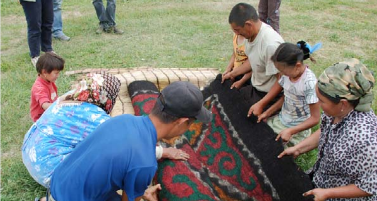
Arbeit im Clan: Die Teppiche werden meist von mehreren Personen gemeinsam hergestellt.