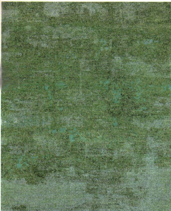
Moderne Kunst auf Teppich, Design D. Miso, geknüpft in Nepal. L'art moderne a la tapis, noué a Nepal.