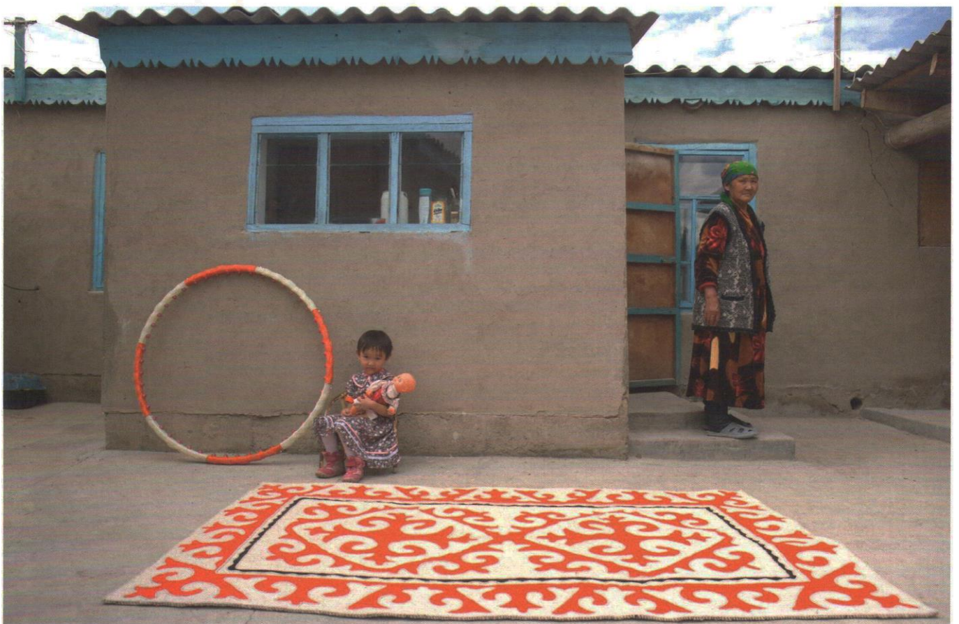
Teppichkunst aus Kirgistan für Feelfelt. Shyrdak, handgefilzte Schafwolle. Laine main feutré.